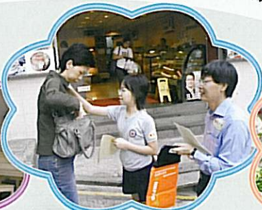
全力以「輔」為青年賣旗日