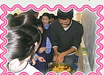
把手帕放在植物染料中