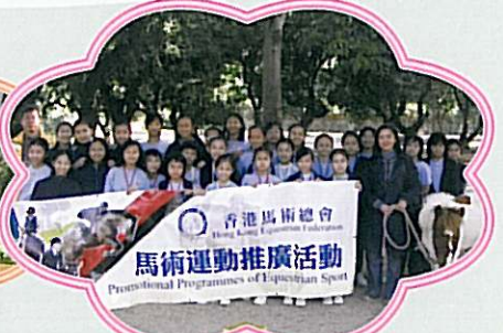
參觀「屯門公眾騎術學校」