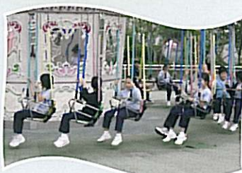
同學們在遊樂場上玩得多開心!