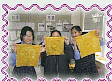
植物也能染出美麗的作品呢!