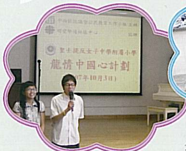
「龍情中國心」國民教育講座

上學期聯課活動繁多，未能盡錄，欲知詳情及觀賞照片，請瀏覽學校網頁 | 校園動態 | 聯課活動。