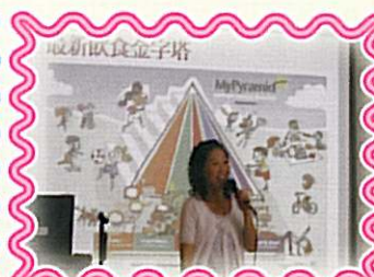
舉辦健康飲食講座

我校為倡導校園健康飲食文化及培養學生均衡飲食的習慣，本年度參與了衛生署舉辦的校園至「營」特工計劃。為配合主題，進行了以下的活動：