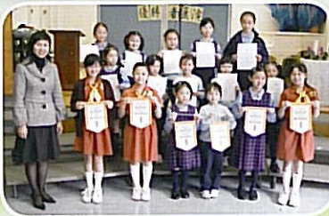
粵語及普通話獨誦優勝者