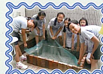
天井開設「有機食材園」