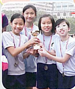
女子乙組接力隊成員