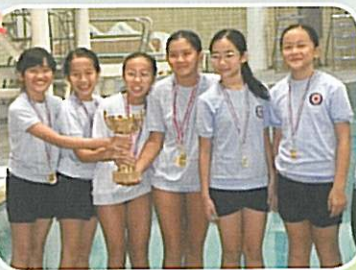
女子甲組泳隊成員