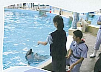
通過多元化的學習活動，同學們上了益智的一課。