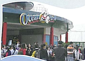
大家懷著興奮的心情等待進入海洋公園。