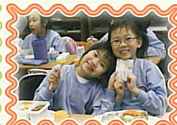
星期一是「有機菜」日!