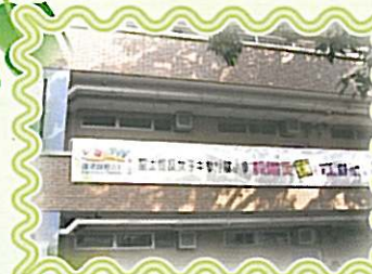
參與衛生署的校園至「營」特工計劃