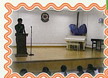
舉辦有機種植講座